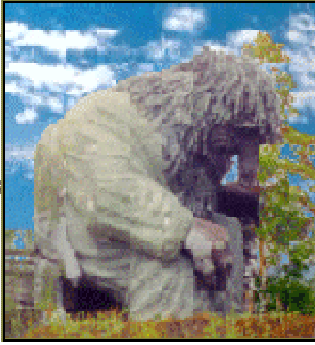
Ein Troll - groß wie ein Baum!